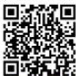
电商产业发展扶持政策